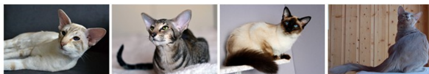
- siameser - oriental - balineser - orientalsk langhår -

Når du mener du har funnet fram til noen aktuelle navn via bekjente, katteklubber og/eller interesseforeninger, kan det være interessant å ta en titt på oppdretternes hjemmesider eller lete dem opp på Facebook. Her vil du finne mye informasjon, og du kan danne deg et bilde av hvem som har siamesere, orientalere, balinesere og orientalsk langhår, er aktive, har hyppige kull, fokuserer på utstilling, oppdretternes kattehold osv.