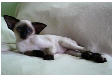
Bilde 1: Sånn fortjener en liten «prins» å ha det. Brunmasket siameser, Golden Dragon Sol Gebo xiii